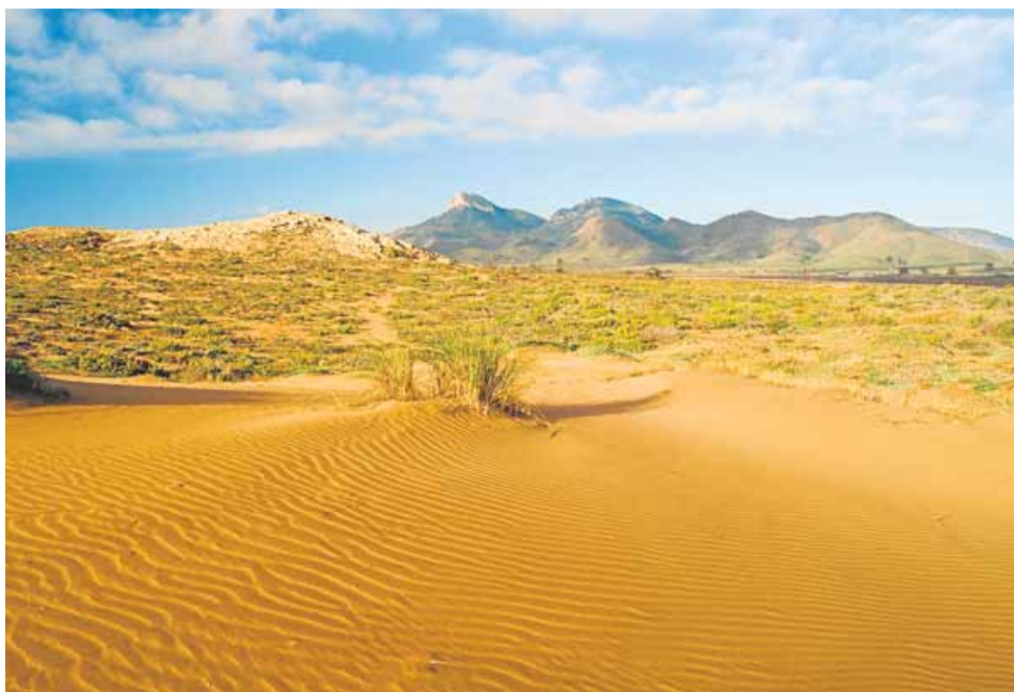
Duna en el Parque Regional de Calblanque, Monte de las Cenizas y Peña del Águila. CARM

Extensión: 1.032,21 ha. Término municipal: Águilas y Lorca. Fauna: Tortuga mora, sapo corredor en los matorrales y eslizón ibérico en playas y arenales. Vegetación: Destacan las comunidades sabinares de Cabo Cope, artales y caornicales de Lomo de Bas y los saladares y albardinales de la marina.